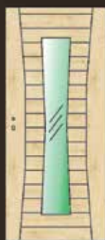
Modell I13 LA