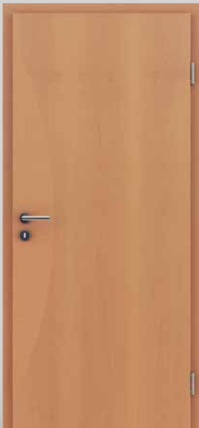
HIGHLINE / I3 Buche Intarsie Buche