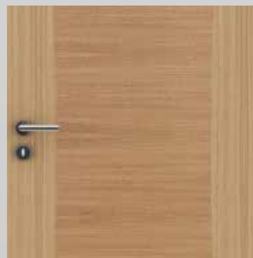
HIGHLINE / I13 Europäische Eiche