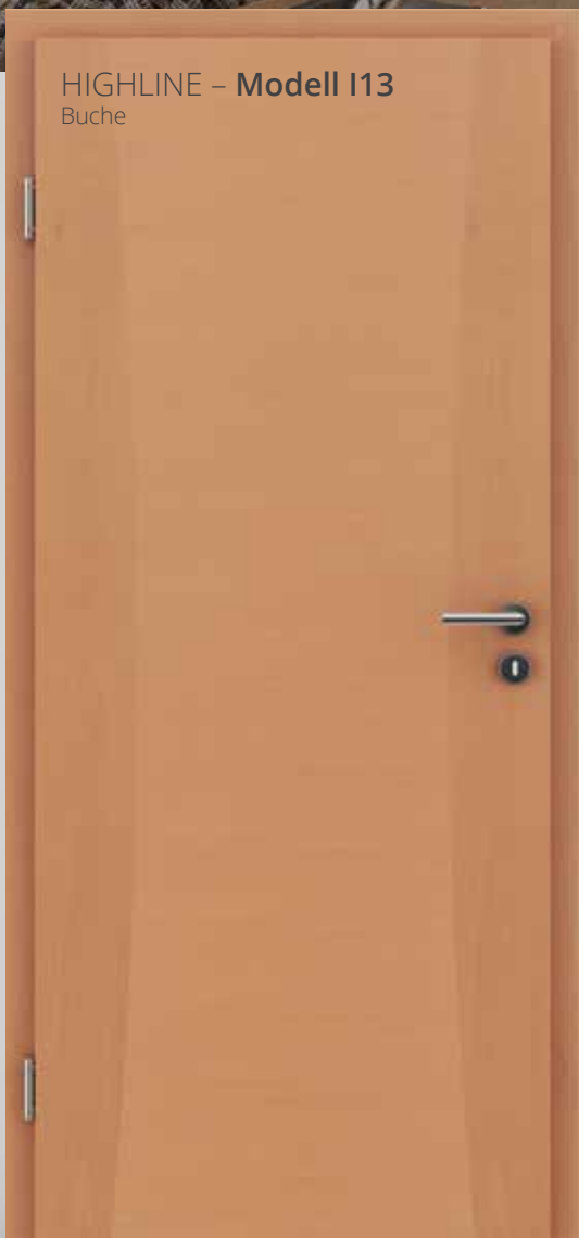
HIGHLINE – Modell I13 Buche